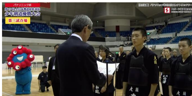
ミャクミャク君も応援に 中学生Bチーム3位表彰

熱戦の様子は、下記の「大阪府剣道連盟特設ホームページ」からYouTubeのライブ配信や試合結果をご覧ください。