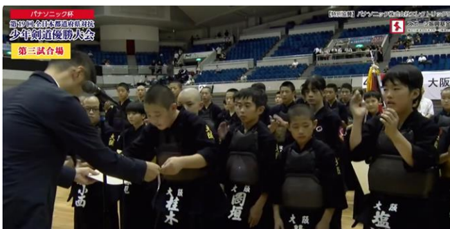
頑張りました！ 小学生Aチーム3位表彰