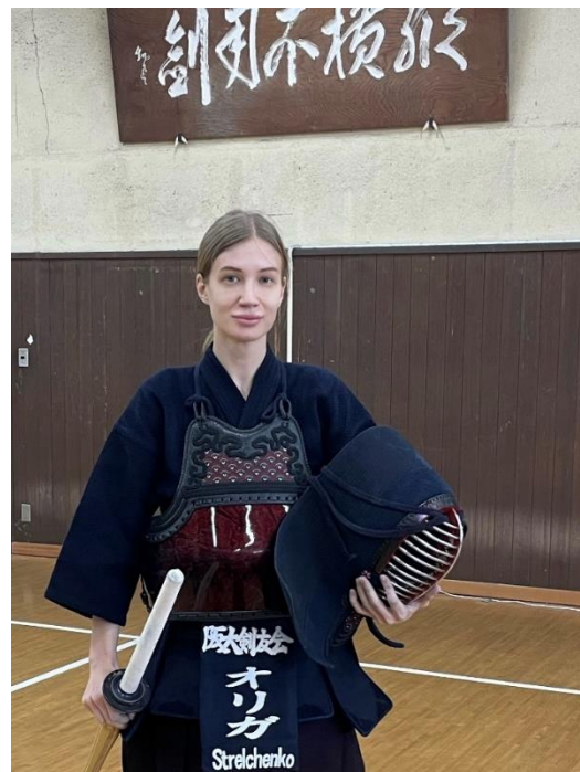
(大阪大学剣道場にて)

コロナ禍のため、残念ながら、稽古する機会が減少してきました。それにもかかわらず、勉強、剣道の練習(一人稽古含む)、仕事などの活動を続けるのが大事です。それ故に、今後も自分の文武両道を一生懸命に頑張っていきたいと思っております。